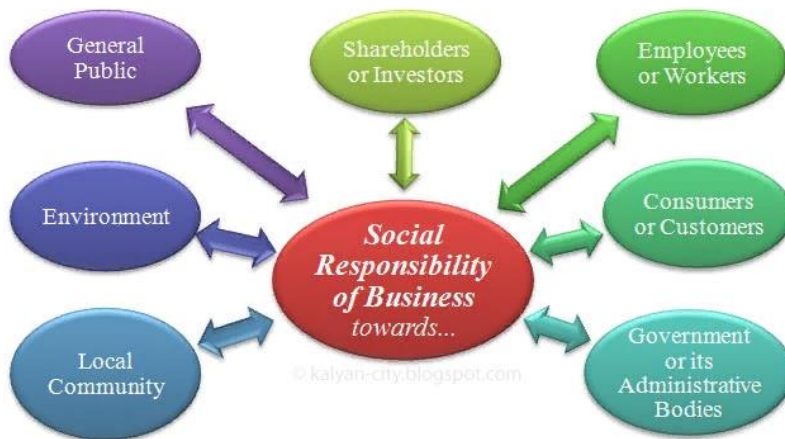
Figure No. 1 Social Responsibility of Business Towards Society.

Generally, the social responsibility of business comprises of certain duties towards entities, which are depicted and listed below.