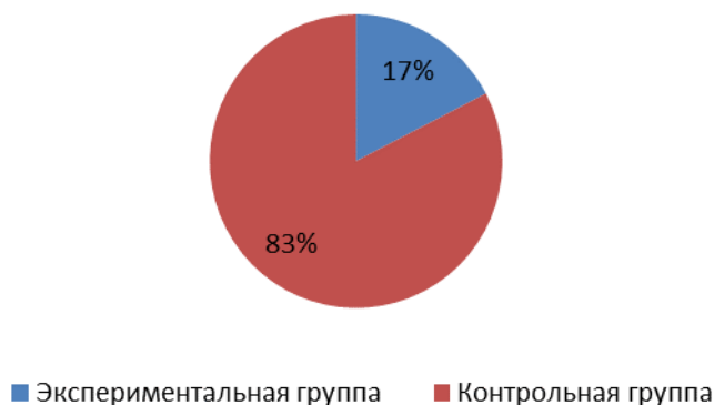
Рисунок 2. Успешность восприятия на слух слов квазимонимов в экспериментальной и контрольной группах (в %).

Пример оформления рисунка представлен ниже.